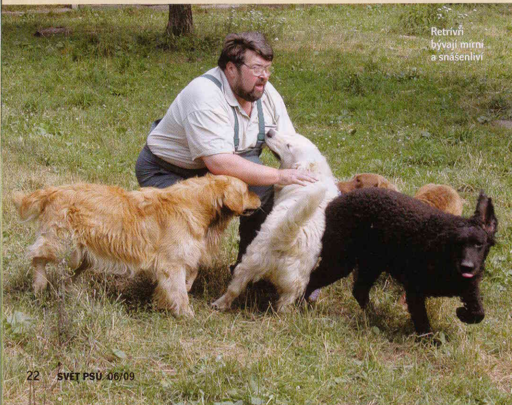
Retrívři bývají mírní a snášenliví

Určitým jeho protipólem je curly coated retrívř - to je zase aristokrat duše. Udržuje si určitý odstup. Dám vám příklad: zatímco ostatní naši retrívři žebrají o pohlázení, curly se milostivě nechá